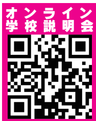
オンライン 学校説明会