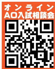
オンライン AO入試相談会