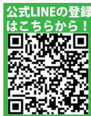
公式LINEの登録 はこちらから！